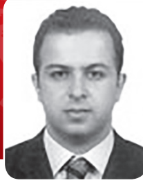
Av. Necati TORUN