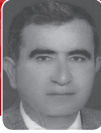
Av. Atilla İNAN