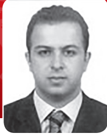
Av. Necati TORUN