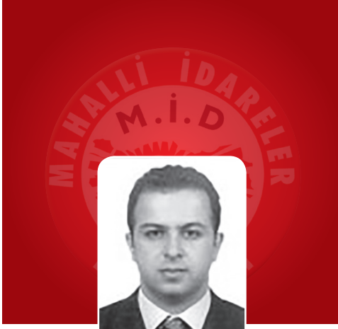
Av. Necati TORUN