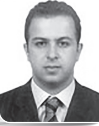
Av. Necati TORUN